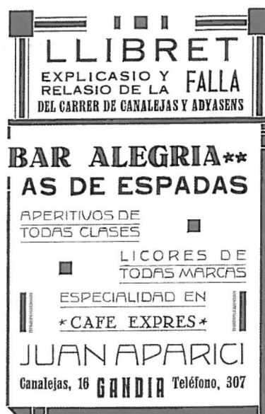
Portades del llibret de la Falla Plasa Mercat (de la República) 1932 i de la Falla Carrer Canalejas i adyasents 1935. Col·lecció J.J. Coll.

És a partir de la Guerra Civil quan la consolidació de les comissions falleres és ja constant, en Gandia en 1943 torna l'organització de la festa i des d'aquest moment mai deixarà de celebrar-se a la ciutat. El ja esmentat llibret anuari serà la tipologia que acompanyarà a les comissions, aquest deixarà constància del cens, de les reines de falla, dels poemes d'exaltació i, a més de l'explicació i relació de la falla, començaran a obrir-se pas els articles de temàtica valenciana o folk, en paraules de l'estudiós Jesús Peris.