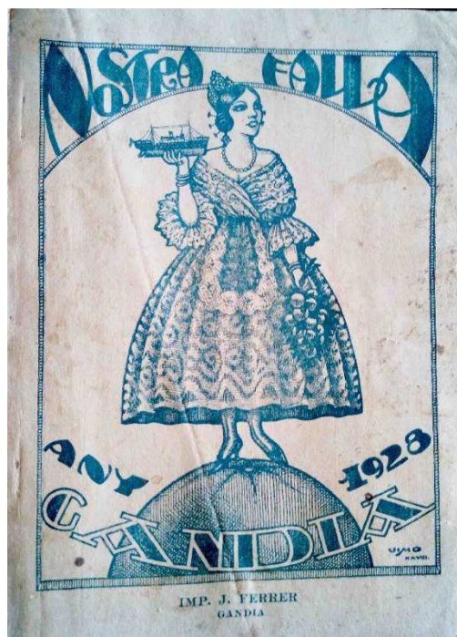
Portada del llibret Nostra Falla , de la Falla Passeig Germanies any 1928.